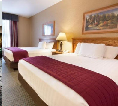
Pear Tree Inn