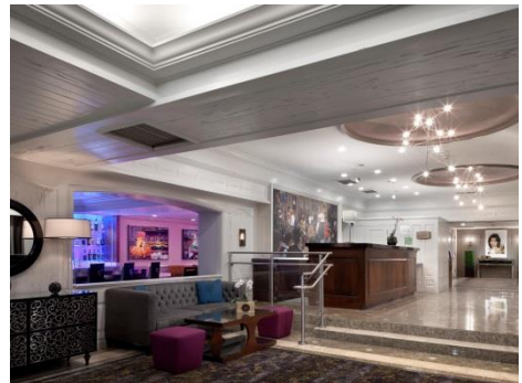
Holiday Inn Downtown Superdome