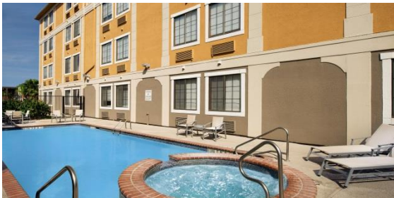
Holiday Inn San Antonio Downtown Market Square