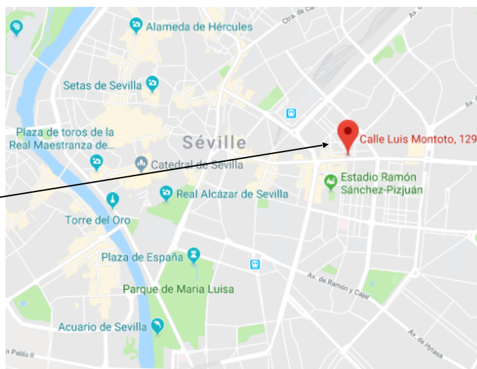
Hôtel Senator Virgen de Los Reyes 3***